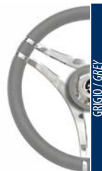
GRIGIO / GREY