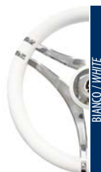
BIANCO / WHITE